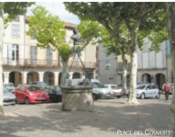
PLACE DES COUVERTS

Réalmont est la commune la plus importante du canton. Elle centralise commerces, artisans, médecins, pharmaciens, opticiens, vétérinaires..., industries et services tels que la Poste, la Gendarmerie, le Trésor Public, les banques, une maison de retraite, une crèche associative, deux écoles maternelles