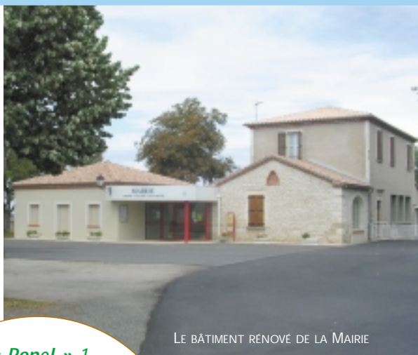
LE BÂTIMENT RENOVÉ DE LA MAIRIE

Le conseil municipal a réalisé des aménagements afin d'améliorer la qualité