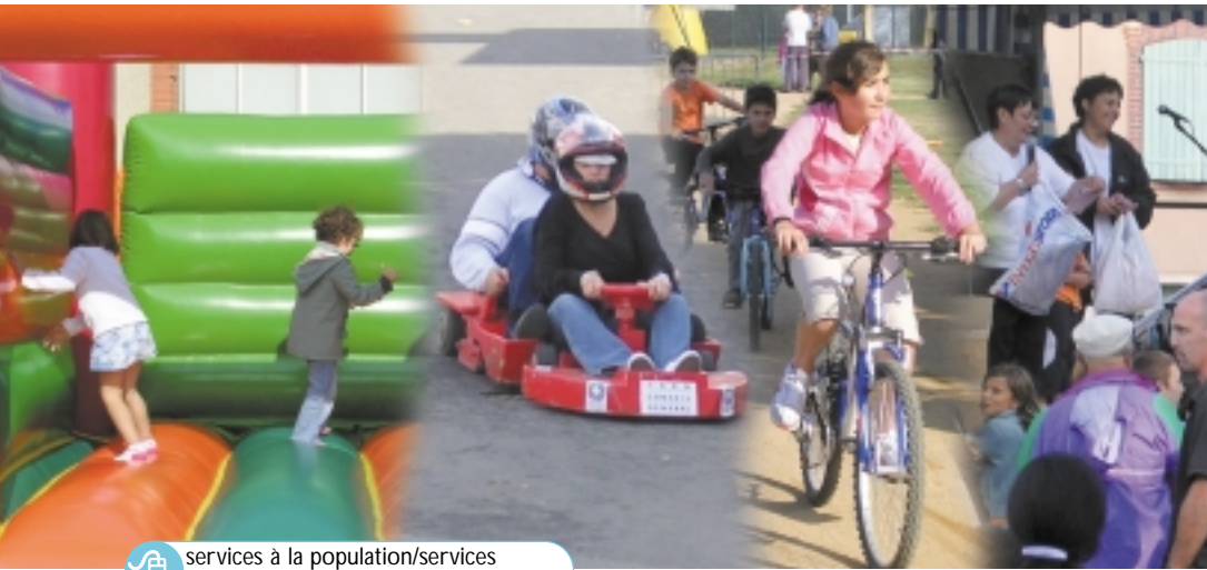
services à la population/services de la CCR/enfance jeunesse

La fête intercommunale du sport, de la culture et des loisirs jeunes, inscrite dans le cadre du contrat éducatif local, se déroulait cette année sur la place du Foirail à Réalmont.