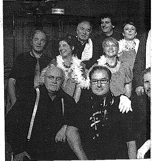
• La compagnie du jet d'eau.

La Clé des Chants de Lombers reçoit «La compagnie du Jet d'Eau» qui vient faire son cabaret le 20 février à 16h30 à la salle des fêtes de Lombers. La compagnie du Jet d'Eau est également ses prestations aussi