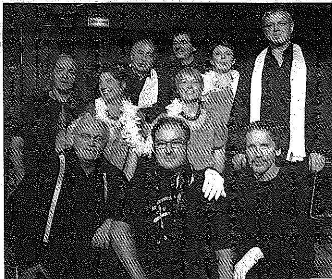
• La compagnie du jet d'eau.

La Clé des Chants de Lomers reçoit «La compagnie du Jet d'Eau» qui vient faire son caba-